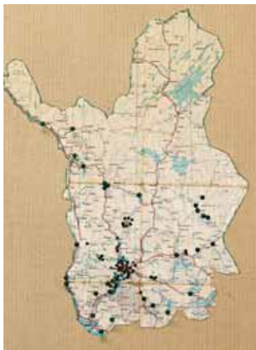
Tiaispönttöjen sijoittuminen näkyy kartasta.