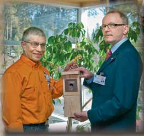
Luontoteko tiaiselle synnytti 101 lintukotoa.