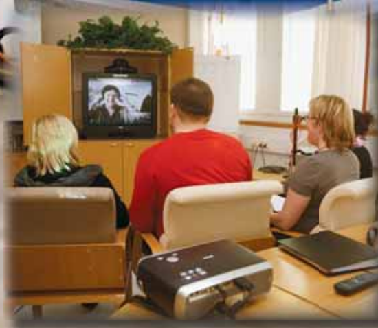
Depressiokoulua videon kautta.