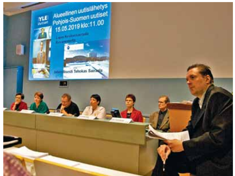
Ryhmätöet innostivat AamuTV:n osallistujatkin heittäytymään vuoteen 2019.